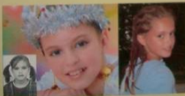
Фото из личного дела и из семейного альбома.