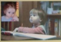
Любима. В доме ребенка 2005 г. "Зарничка" Санкт-Петербург.

Но совершить это "обыкновенное" чудо - и важно сделать!