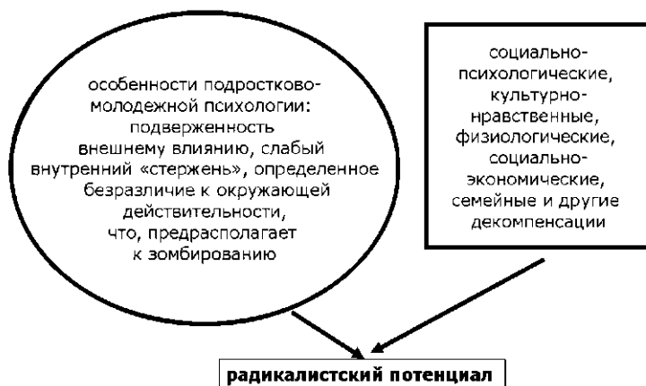
Рис. 3. Социокультурные индикаторы экстремистского потенциала.

деятельности 32 . Коллективная идентификация молодежи имеет особое значение для реализации потребностей представителей этой социально-демографической группы. На рис. 4 показано взаимовлияние некоторых личностных и групповых индикаторов, объясняющих индивидуальную и групповую идентичность в экстремистских организациях.