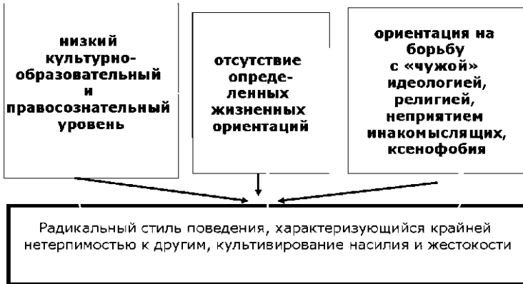
Рис. 2. Психологические индикаторы скрытой формы экстремистского потенциала молодёжи.

мотив власти над людьми, привлекательности терроризма как особой деятельности, «товарищеская» мотивация эмоциональной привязанности, мотив самореализации.