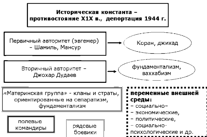
Рис. 6. Власть и идеология в сепаратистских и фундаменталистских движениях в Чеченской Республике.

Для профилактической работы в рамках индивидуального терроризма необходима система специального антитеррористического воспитания молодежи, контакты с родственниками, родителями. В рамках такой