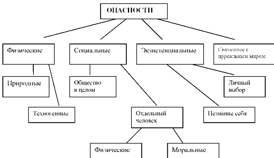
Рис.1. Содержательная классификация

В структуре новостных сообщений в основном представлены ситуации, относящиеся к группам физических и социальных опасностей, и практически